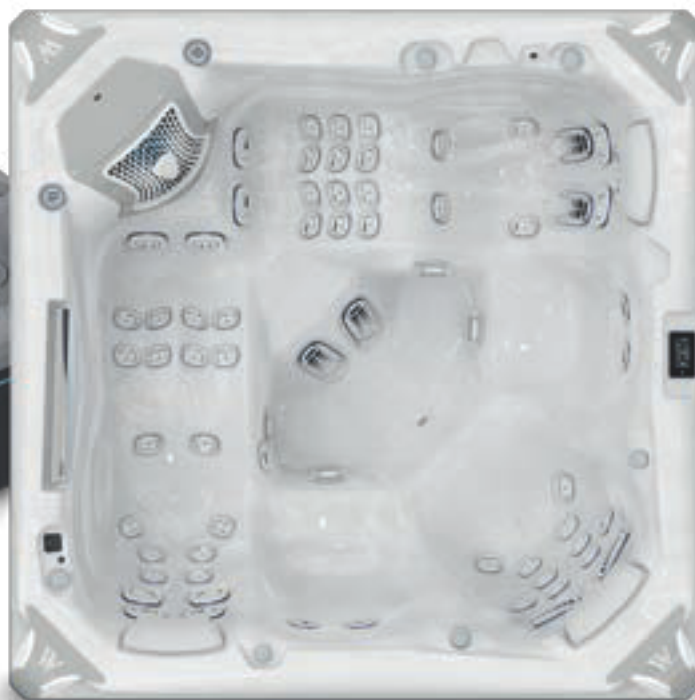
↑ Premium Edition