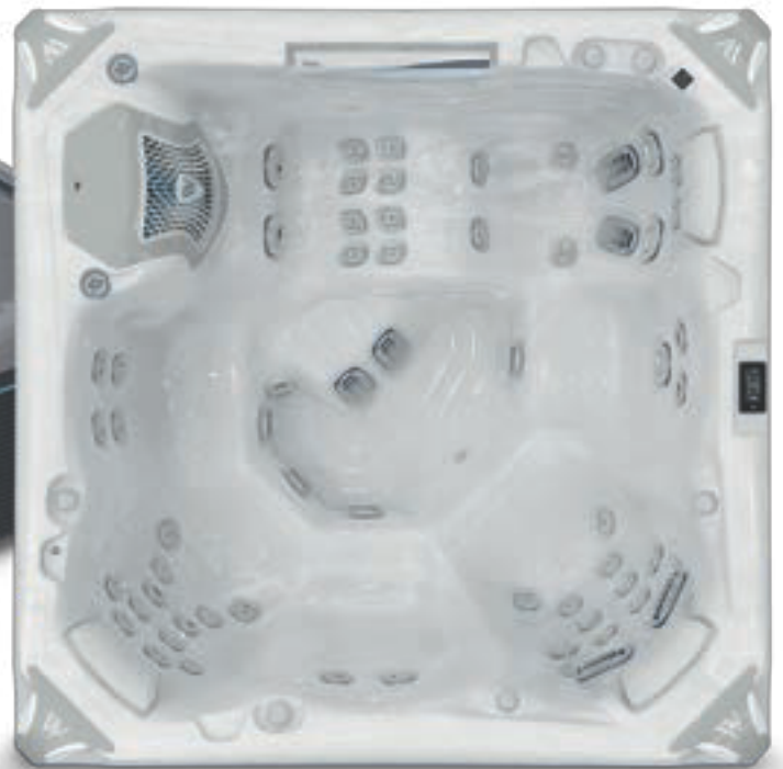
↑ Premium Edition